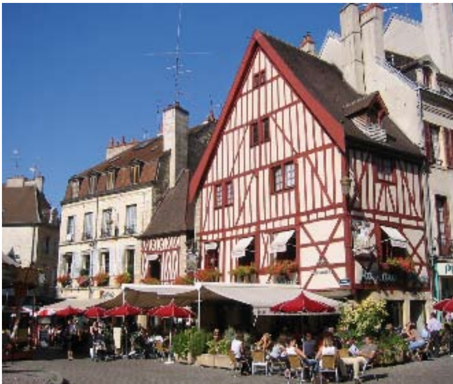
La charmante place François Rude

Ancienne cité médiévale, la première ville de Bourgogne dévoile au visiteur ses agréables rues piétonnes jalonnées d'hôtels particuliers, ses riches musées, la somptueuse cathédrale Saint-Bénigne... Dijon, c'est aussi la porte d'un vignoble aux crus de renommée mondiale, à associer à l'une des spécialités gastronomiques de la région.