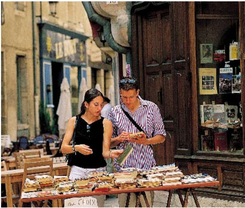
Flânerie dans les rues du centre historique

Ancienne cité médiévale, la première ville de Bourgogne dévoile au visiteur ses agréables rues piétonnes jalonnées d'hôtels particuliers, ses riches musées, la somptueuse cathédrale Saint-Bénigne... Dijon, c'est aussi la porte d'un vignoble aux crus de renommée mondiale, à associer à l'une des spécialités gastronomiques de la région.